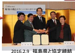
2016.2.9 福島県と協定締結