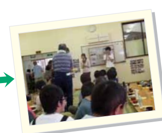
あたご共同作業所の皆さんと交流