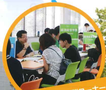
過去問コーナー・相談コーナー