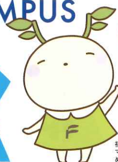
福島大学公式 マスコットキャラクター めばえちゃん