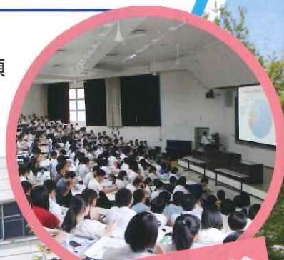
模擬授業 / 学類説明会