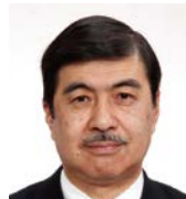
日本大学工学部 教授