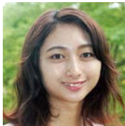
福島大学 4年生 共生システム理工学類