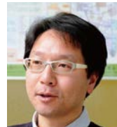
福島大学経済経営学類 教授