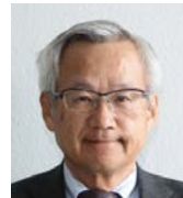
福島県産業振興センター エネルギー・エージェンシーふくしま代表