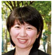
福島学院大学 学長