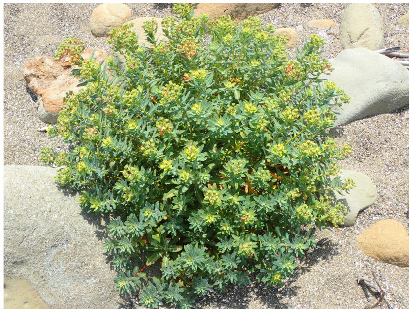
図 1：イワタイゲキ（和歌山県友ヶ島）

本研究は、2024年5月10日に、国際誌「 American Journal of Botany 」のオンライン版に掲載されます。