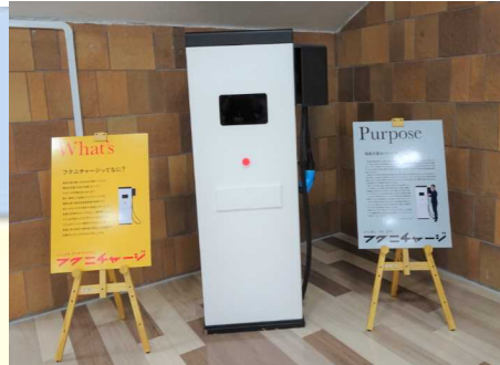
「フクニチャージ」説明コーナー