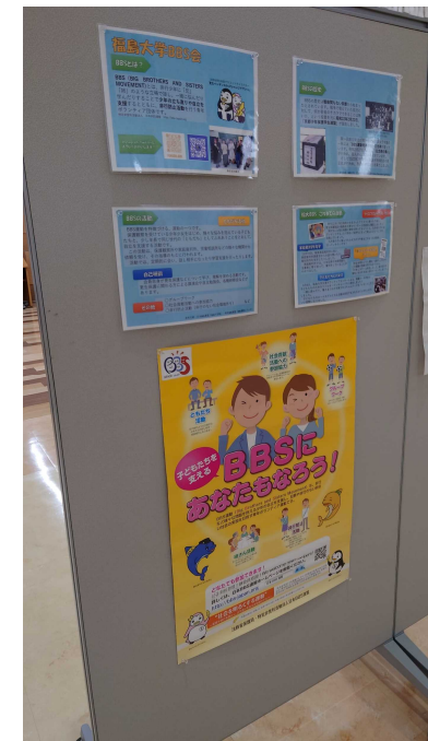
福島大学矯正展のBBS会ブース

8月6日、福島大学災害ボランティアセンターによる、檜葉小・中学校の子どもたちのためのリトルオープンキャンパスに福大BBS会も参加しました！ 子どもたちのロールモデルとなる活動はBBSでも力を入れていきたいので、いい経験になりました。