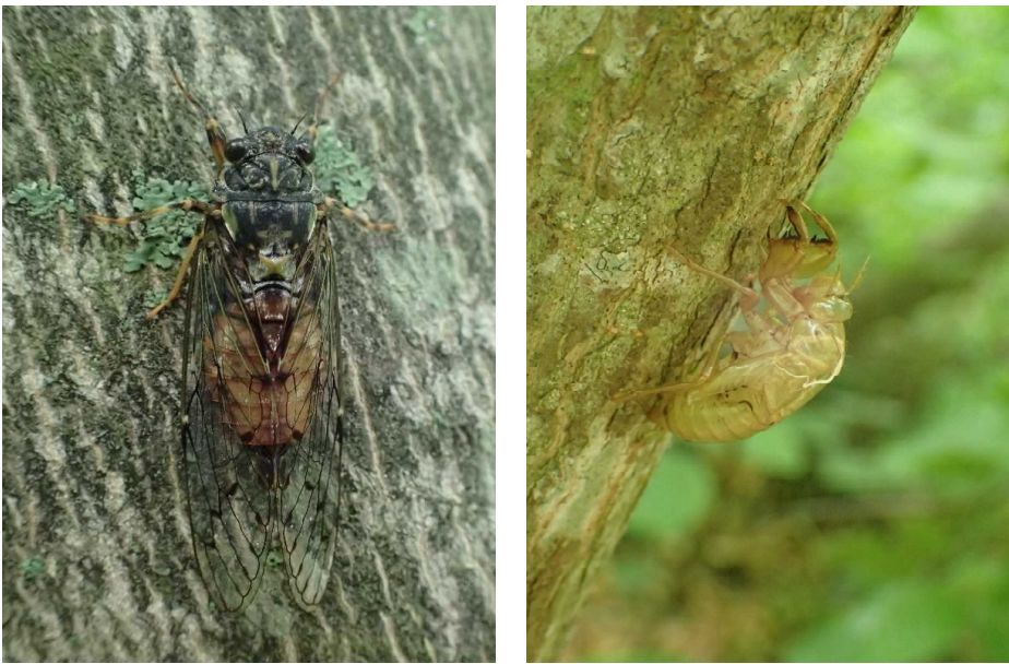
図1 エゾハルゼミ成虫（左）と抜け殻（右）