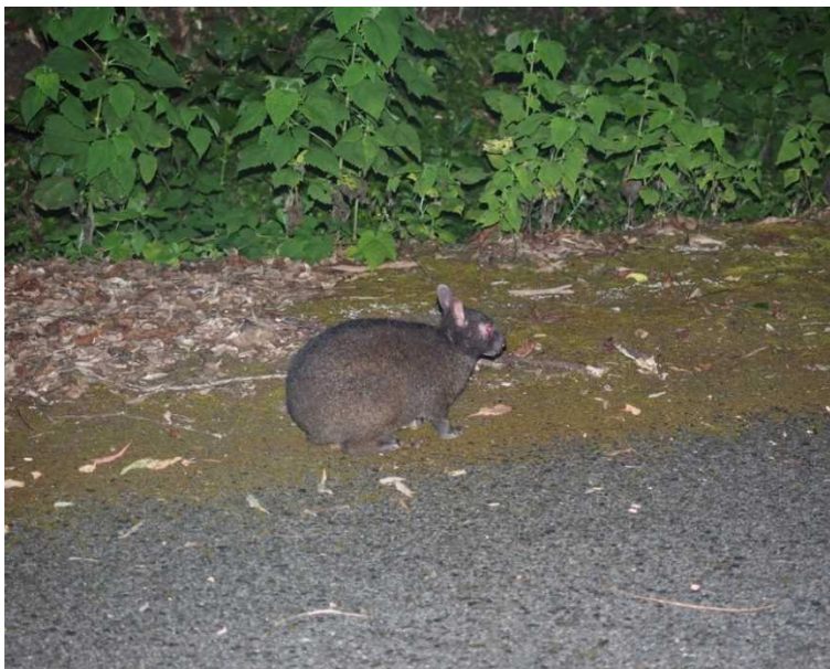
写真 1. アマミノクロウサギ

徳之島の林道及び沢においてアマミノクロウサギの糞を採取し、DNA を抽出しました。得られた DNA から、ミトコンドリア D-loop 領域 2 の一部の塩基配列を解読し、核マイクロサテライト遺伝子座 3 の繰り返し配列の長さを測定しました。これらの情報をもとに、サンプルの遺伝子型を決定し、クラスタリングによって徳之島内に存在する遺伝的なグループを決定しました。また、南北の集団が分断された年代など集団動態の歴史を推定しました。