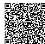
体温・行動記録表

(2) 新型コロナウイルスに関しては、福島県ホームページ 新型コロナウイルス感染症 関連情報ポータル（アドレスは下記）を参考に対応してください。