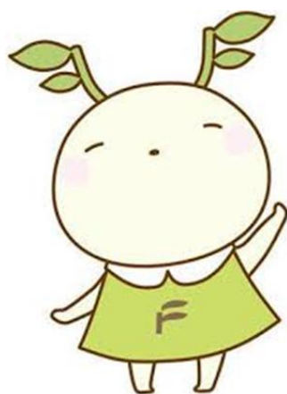
福島大学公式マスコットキャラクター めばえちゃん