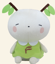
A-1 めばえちゃんぬいぐるみ (H200×W150×D100mm)