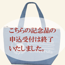
B-2 保冷バック (H200×W300×D130mm)