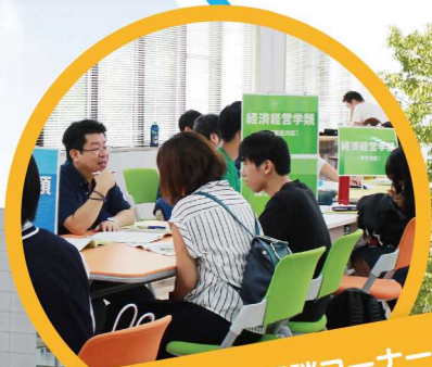
過去問コーナー・相談コーナー