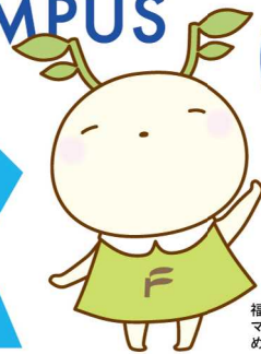
福島大学公式 マスコットキャラクター めぼえちゃん