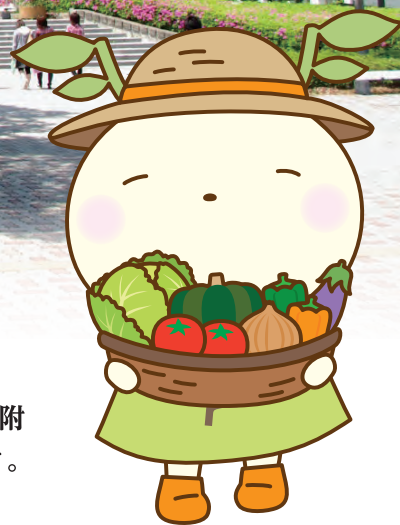
福島大学公式マスコットキャラクター めばえちゃん

申込受付から査定・報告、および送金は「古本募金きしゃぽん」(運営:嵯峨野株式会社)が担当します。古本募金1回のご参加につき、きしゃぽんからも100円が寄附されます。