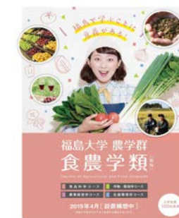
食農学類 2019年4月設置構想中