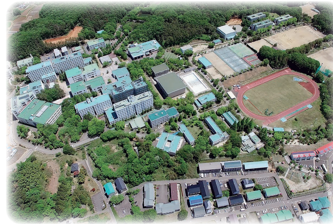
金谷川キャンパス