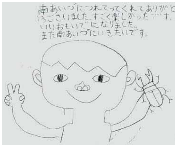
昨年度の参加者の感想文（一例）