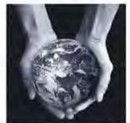
北澤静雄「Embracing the Earth」制作年未詳