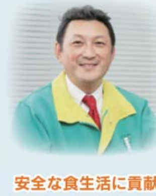
安全な食生活に貢献