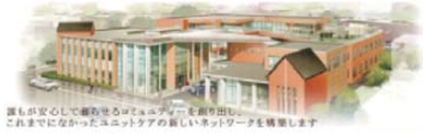
エヌジェアイ 「老人施設」ではなく「コミュニティ」づくりへ