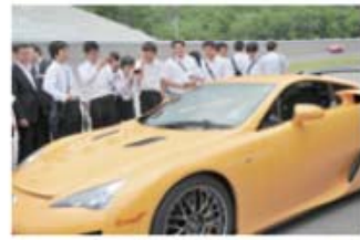
東洋システム 高校生たちに夢を与えるイベントを開催

福島の未来を考え、事業に創造力を注ぎ込み、強いリーダーシップを発揮するこれら3人の経営者による鼎談を中心に、「中小企業の力で福島の未来を拓く」というテーマで開催します。