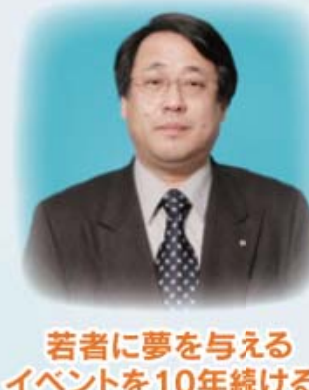
若者に夢を与える イベントを10年続ける!