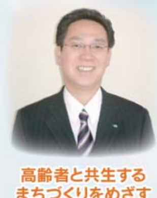
高齢者と共生する まちづくりをめざす