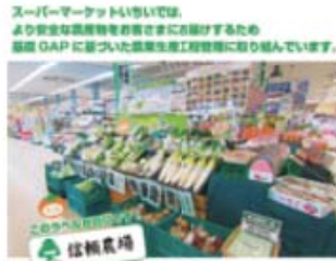
いちい 「食の安全」に信頼のブランドづくりで取り組む