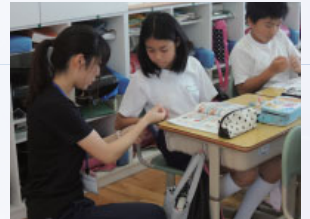
家庭科の実技支援

教員を目指すAさんは、支援しながら子ども理解や指導方法を探究し、少し自信が持てるようになりました。教育実習を終えたBさんは、継続して実習校にかかわることができています。教員の仕事が自分にむいているか悩んだCさんは、学校を知ることが一番だと考えて活動を始めた結果、子どもが好きな自分に気がきました。人間発達文化学類は教員を目指す皆さんを全力でサポートしていきます。