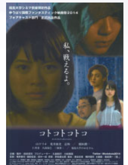
映画『コトコトコ』チラシ

映画作りは、共同作業の賜物。個性をぶつけあいながら一本の作品を作る過程で、様々なものを学び取ってほしいと考えています。