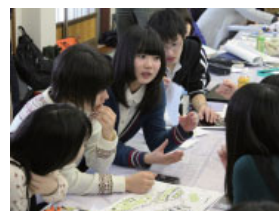
集中スクールの様子

福島大学は、福島・宮城・岩手の中高生100人をメンバーとする「OECD東北スクール」を実施しています。これは、「2014年8月にパリで東北の魅力を世界にアピールするイベントをつくる」というプロジェクト学習です。この活動に福大生も積極的に関わり、中高生と一緒にフランスに渡り、イベントの成功を支援します。