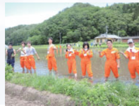
学生の手で田植えを行なった

福島大学に入学するのであれば、復興の現場で学んでみませんか。ふくしま未来学とは、原子力災害の経験を踏まえ、地域課題を実践的に学び、地域再生を目指す、福島大学独自の特修プログラムです。なかでも「むらの大学」の授業では、地域実践をメインとし、夏休み期間には、約2週間地域で生活しながら地域課題を発見し、地域再生のプログラムを学生自身が考え実行していきます。ほかにも、被災地復興に寄与する履修科目を、学類に関係なく選択することができ、全体で20単位以上習得すると、ふくしま未来学の修了証が交付されます。