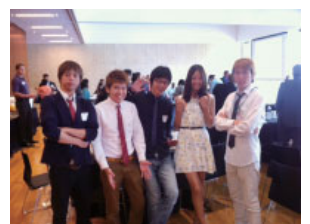
海外インターンシップの様子

2014年で5年目を迎える「海外インターンシップ」は、経済経営学類「英語副専攻」制度の中核的なプログラムです。『英語を学ぶのではなく、実際の職場で英語を使うことにより実用的な英語を身につけるチャンスを提供すること』を理念に、毎年着実に成果をあげています。昨年度は米国テキサス州ヒューストン市の住宅管理機関や市役所等に派遣されました。学生たちは、受付対応であったり、市のイベントにスタッフとして参加したりと実践的な研修を受け、実務体験を通じて大きく成長して帰国しました。本プログラムは、他学類生にも参加のチャンスが与えられています。